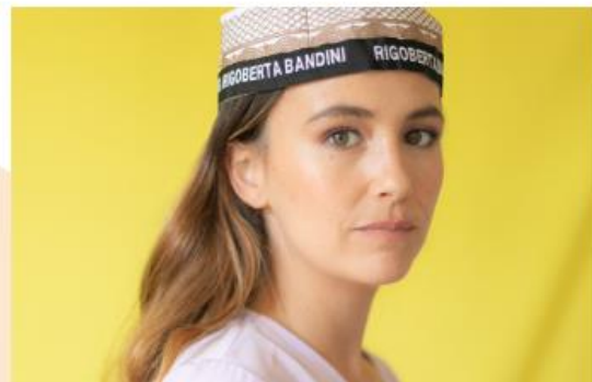
Paula Ribó (Rigoberta Bandini)