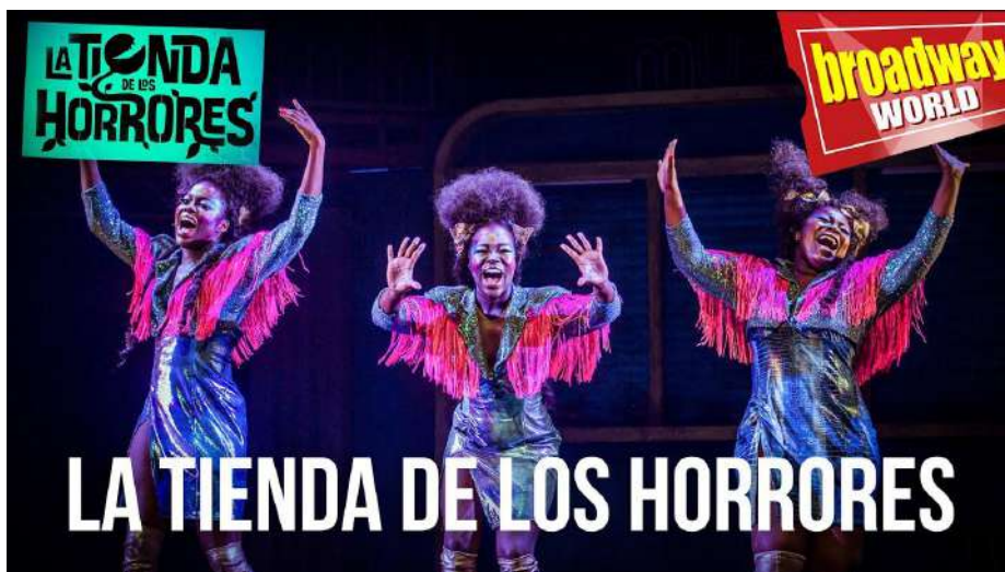
The Sey Sisters